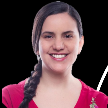
Candidata Presidencial por Juntos por el Perú