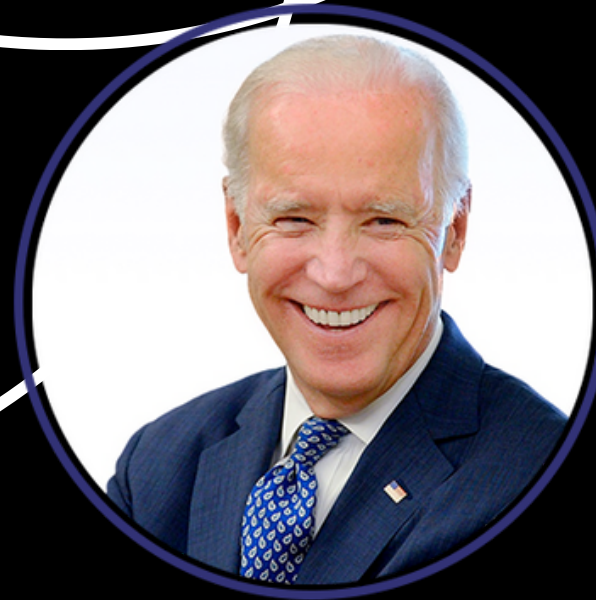
Joe Biden 46° Presidente de los EEUU de N.A.