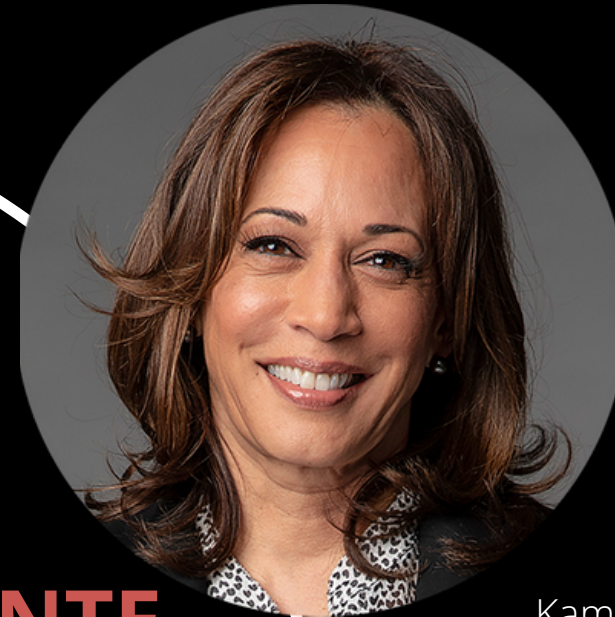
Kamala Harris 49° Vice Presidenta de los EEUU de N.A.

EXTROVERTIDO SOCIABLE AMBICIOSO SEGURO CONFIADO