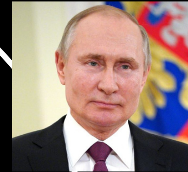
Vladimir Putin Actual Presidente de la Federación Rusa