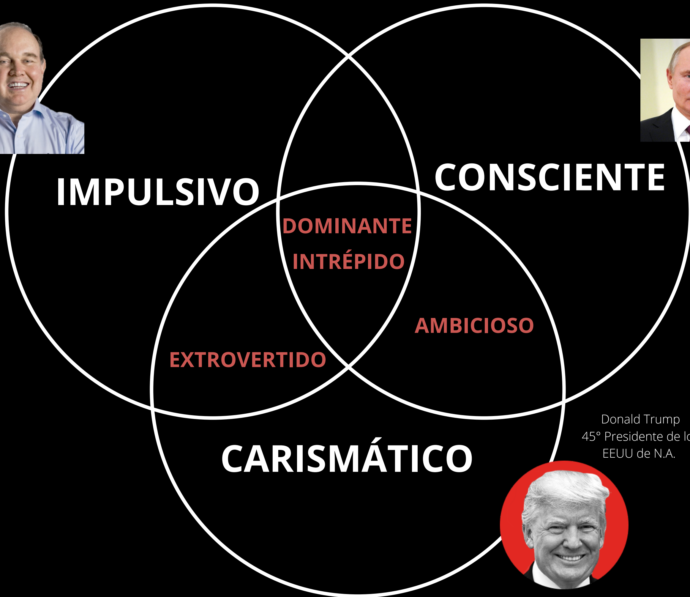
Donald Trump 45° Presidente de los EEUU de N.A.