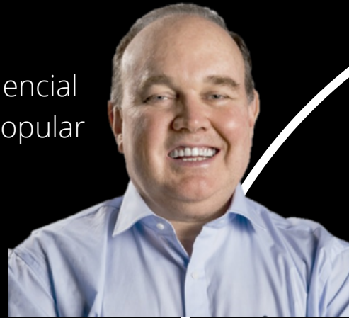
Candidato Presidencial por Renovación Popular