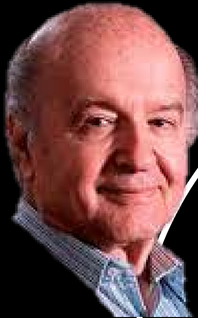
Candidato Presidencial por Avanza País