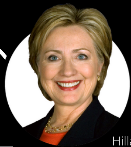
Hillary Clinton Ex Secretaria de Estado de los EEUU de N.A.