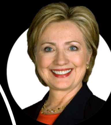
Hillary Clinton Ex Secretaria de Estado de los EEUU de N.A.