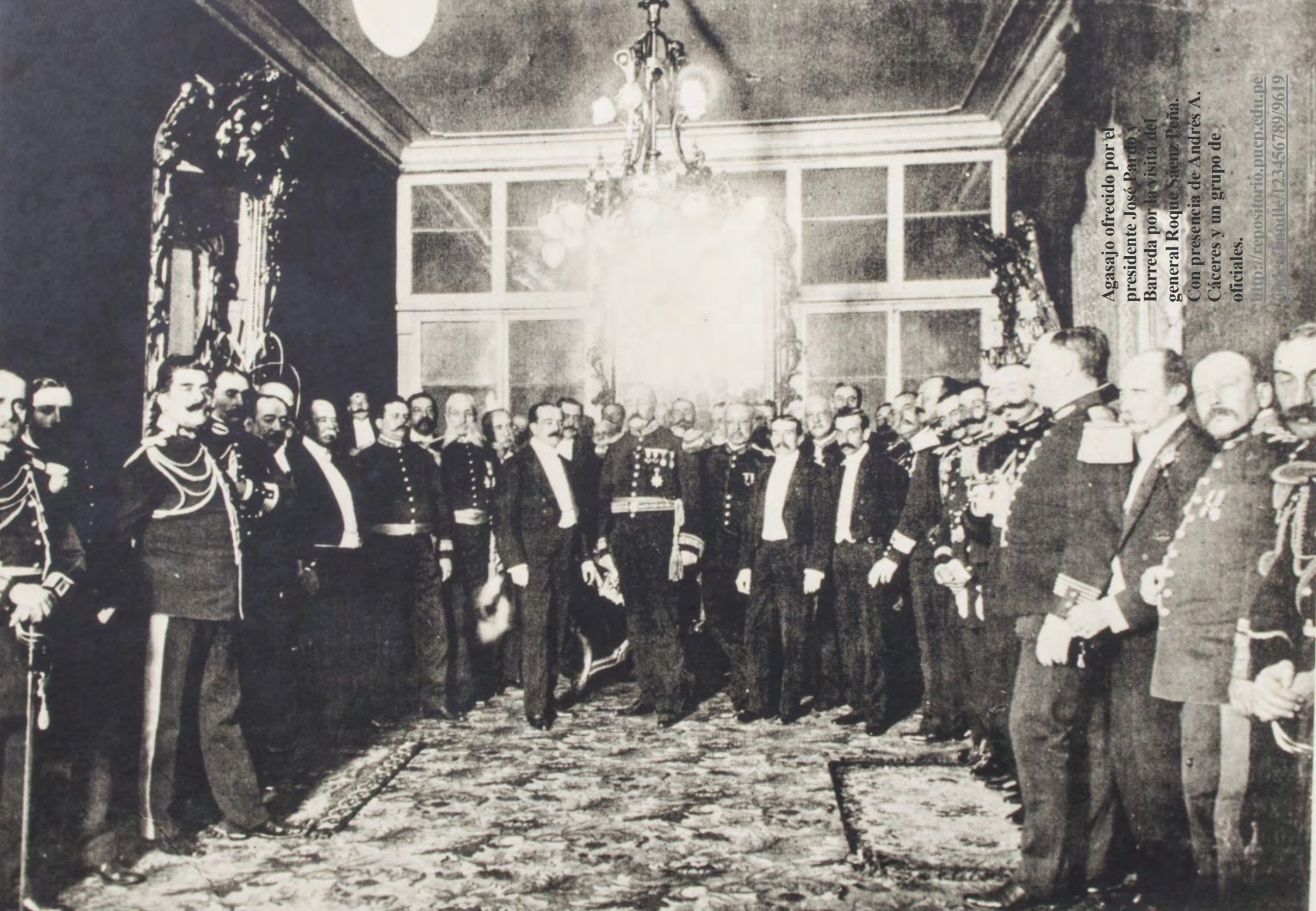
Agasajo ofrecido por el presidente José Pardo y Barreda por la visita del general Roque Sáenz Peña. Con presencia de Andrés A. Cáceres y un grupo de oficiales.

http://repositorio.pucp.edu.pe/handle/123456789/9619