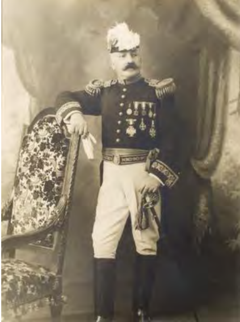
Fotografía del general Roque Sáenz Peña en 1905, durante su visita al Perú, vistiendo el uniforme de general del Ejército.

Roque Sáenz Peña es una figura de la historia peruana, su protagonismo durante la campaña terrestre del Sur y que culmina con la batalla de Arica durante la Guerra con Chile es una de las muestras de la dimensión latinoamericana de nuestra identidad nacional.