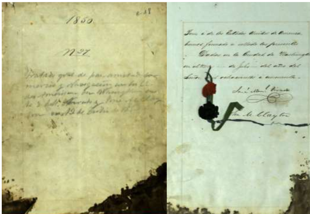
Figura 3. Primer tratado firmado entre EE. UU y Perú en Washington el 13 de Julio de 1850 (pág. 1 y 114)

firmaría el primer tratado bilateral con los Estados Unidos, y durante este periodo (1846-1872) ambos países llegaron a firmar siete tratados bilaterales 5 .