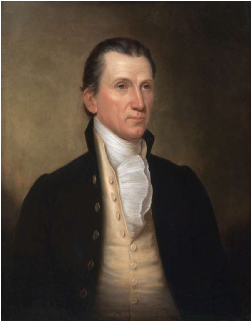
Figura 2. James Monroe 5° Presidente de los EE. UU

El 22 de febrero de 1823 el diario “Gaceta del Gobierno N°16” publicó: “Los Estados Unidos han nombrado sus ministros para los diferentes gobiernos de nuestra América: para Colombia el coronel Todd, para el Perú el general Dearborn y para Buenos Ayres 2 al general Winder” (Gaceta del Gobierno 1823 t IV n 16: 1-4), cabe mencionar que el coronel Todd asignado a Colombia llegó el 7 de octubre de 1822, se entiende que estas designaciones se realizaron en ese año. Otro hecho de importancia es el banquete que ofreció el 8 de marzo de 1823 José de la Riva-Agüero, presidente del Perú a John B. Prevost 3 , agente diplomático de los Estados Unidos (Gaceta del Gobierno 1823 t IV n 20: 1-5).