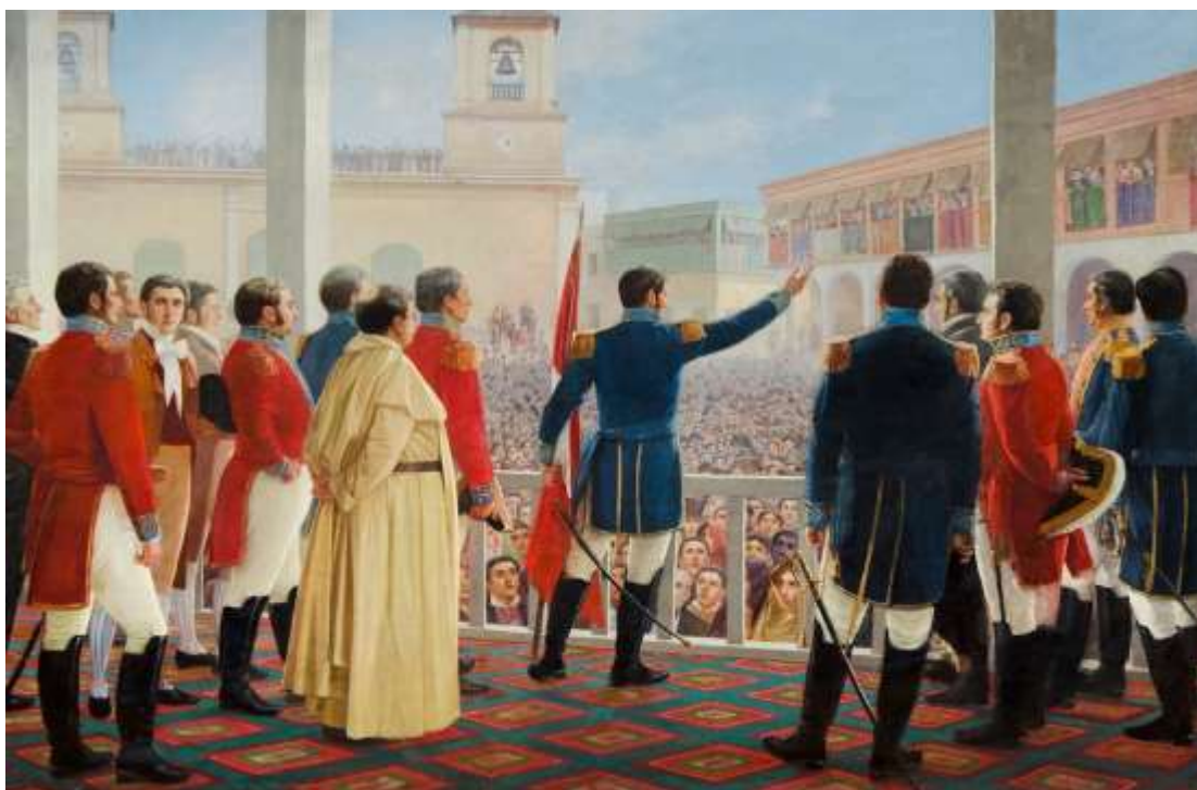
Figura 1. Escenificación de la Independencia del Perú

igual que las nuevas repúblicas en Hispanoamérica tuvo que afrontar gastos para sostener su propio gobierno, el congreso, las representaciones diplomáticas en el exterior, la corte suprema de justicia y las fuerzas armadas, erróneamente los libertadores creyeron que existía un amplio superávit fiscal como en los tiempos del virreinato (Contreras 2021: 19-52); otro de los problemas fue, los frecuentes cambios de gobernantes en tan poco tiempo, es decir entre 1822 y 1823, estuvieron José La Mar como presidente de la Suprema Junta Gubernativa del Perú, luego José de La Riva Agüero (el primero en llevar el título de presidente de la república), José Bernardo de Tagle, Antonio José de Sucre hasta la llegada del libertador Simón Bolívar el 10 de setiembre de 1823, fecha en que se le otorga el poder dictatorial. Juan Miguel Bákula señala: "...Ese Estado en ciernes tuvo conciencia de la necesidad de establecer relaciones con el entorno para asegurar su supervivencia, el resultado tardó mucho en ser eficiente." (Bákula 2006: 31-101).