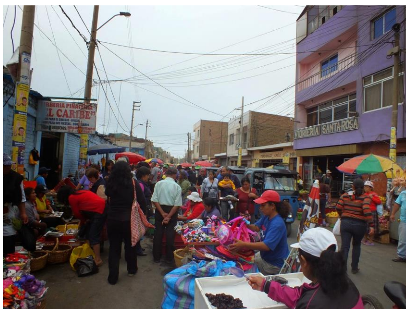
Figura 3. Mercado Ambulante de Provincias - Huacho

Por consiguiente, según el informe del Ministerio de Trabajo y Promoción del Empleo del año 2020, podemos apreciar en la figura N° 3, el subempleo representa el 57.8% de la PEA, es decir más de 9.3 millones de personas, cifra muy superior al nivel del desempleo (7.4% de la PEA). Así también debemos resaltar que el mismo informe del año 2019, tenemos que el subempleo representaba el 42.6% de la PEA, con un 7.6 millones de personas, en pocas palabras podemos denotar el subempleo aumentó en 15.5% del 2020 al 2019.