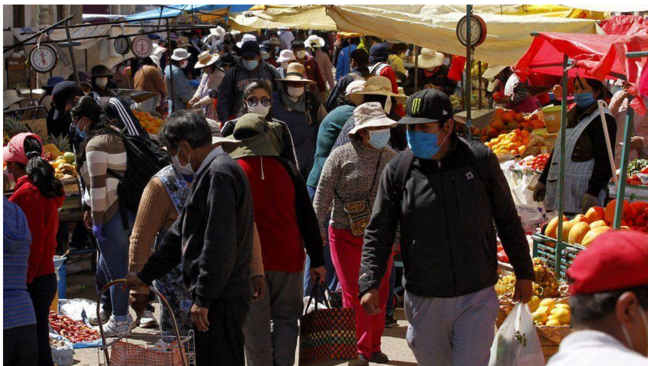
Figura 5. Mercado Informal en Provincias

formas de trabajar como el teletrabajo; ante todo ello debemos tomar las mejores decisiones para conseguir alinear a la fuerza laboral a la nueva realidad económica.