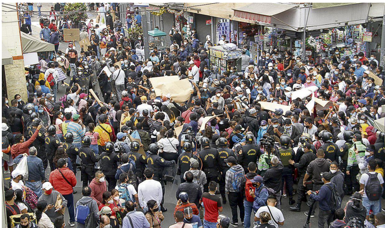
Figura 1. Mercado Informal de Mesa Redonda

Así también, debemos mencionar que toda la actividad informal de la economía no es una realidad solo de nuestro país, pues se puede ver similar situación en otras economías; según el Banco Mundial indica que el sector informal supone la tercera parte del PBI y el 70% del empleo de los mercados emergentes 2 .