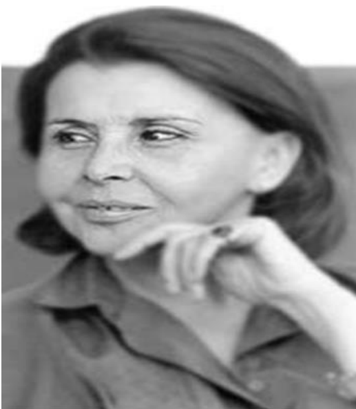
Foto N° 2: Blanca Varela Gonzales

Según Rubén Quiroz, “La poesía adquiere visos espirituales con Varela. El poeta mexicano Octavio Paz había visionado en ella una forma de la luz. Y, cual tromba, su bondad luminosa colorea los contornos. Poesía de fragmentos, de fronteras, de amagos. Vigilia de la palabra extrema en su lucidez. La poesía como forma de vida, sí, pero también como forma de conocimiento. En su caso, la poesía era metafísica pura, en el sentido de profundamente humana, laica, antropológica. (Podestá, 2018, Prólogo, pág. 8).