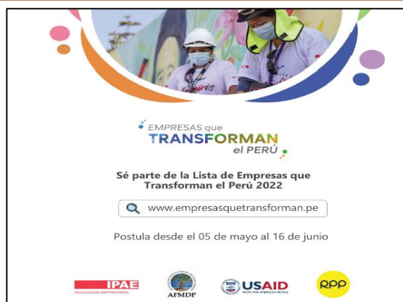
Figura 02. ¡Se parte de las lista de Empresas que Transforman el Perú 2022!

Nota. Aviso de convocatoria para que postulen más empresas que se gestionan con responsabilidad social.