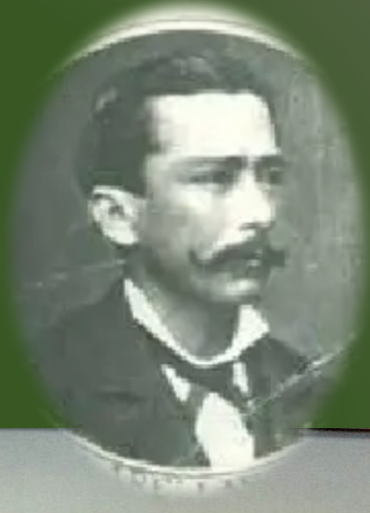
Capitán de Infantería Jefe de la Columna Constitución