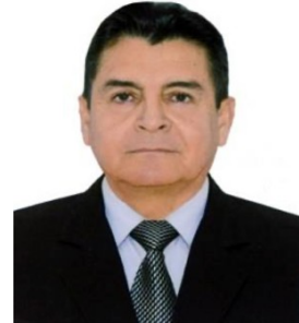
Por Miguel Aliaga Hinojosa Coronel EP

RESUMEN: “El Ejército Unido a la Historia, por fecunda y viril tradición, se corona con lauros de gloria al forjar una libre nación!!!!. ” es una inconfundible frase del himno del Ejército Peruano que sintetiza, anima, identifica y se impregna en el espíritu de cada miembro la del Ejército Peruano. En cada grado de la jerarquía, en cada rincón del Perú, en costa, sierra, selva en los aires y en mar los hombres del Ejército son inseparables de su historia. Hoy en el día del Ejercito, constituye un honor recordar a la tripulación militar embarcada en el Huáscar y que poco reconocidos, pero nunca olvidados, constituye un honor rescatar y poner en dimensión la presencia del Ejército del Perú en el Combate de Angamos como ejemplo permanente de la entrega, sacrificio y heroísmo de los miembros de nuestro Ejército a lo largo de toda nuestra historia y hoy testimonio vivo de nuestro eterno compromiso para con la patria. Honor y Gloria a la tripulación de soldados embarcada en el Monitor Huáscar el 08 de Octubre de 1879; Honor y Gloria a nuestros hermanos de la Gloriosa Marina de Guerra del Perú.