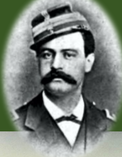
Sargento Mayor de Infantería Comandante de la Guarnición Militar

Comandante del Batallón Inf Ayacucho N° 03